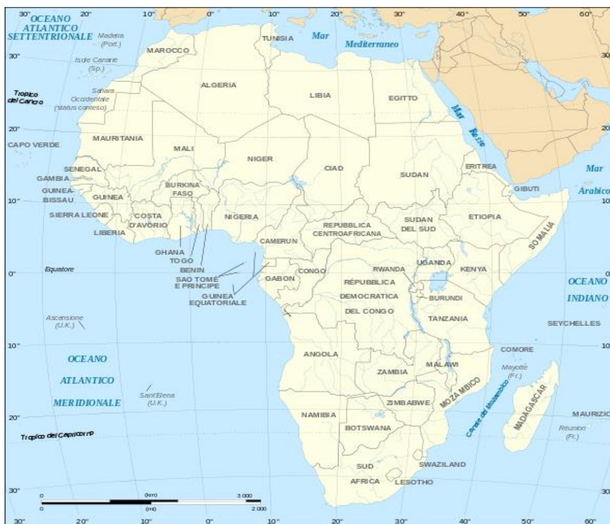
Tabelle di sintesi

Anni 2019-2020 & trend primo semestre 2021